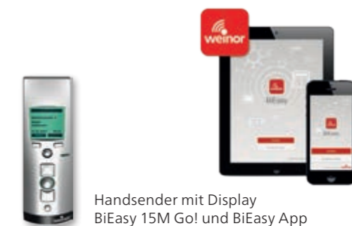
Handsender mit Display BiEasy 15M Go! und BiEasy App

Mit den Heizsystemen Tempura und Tempura Quadra können Sie Ihre Terrasse auch in kühleren Zeiten genießen. Sie sind nachrüstbar und werden unauffällig an der Hausfassade befestigt.