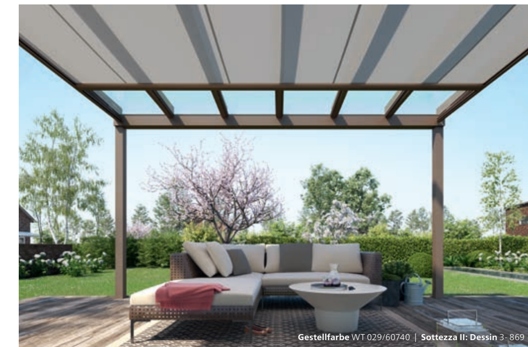
Gestellfarbe WT 029/60740 | Sottezza II: Dessin 3-869

Beim Terrazza Pure VertiPlus ist die Senkrecht-Markise so clever in das Glas-Terrassendach integriert, dass keine Übergänge, Kanten oder Aufsätze zu sehen sind. Alles ist perfekt aufeinander abgestimmt – technisch und optisch.