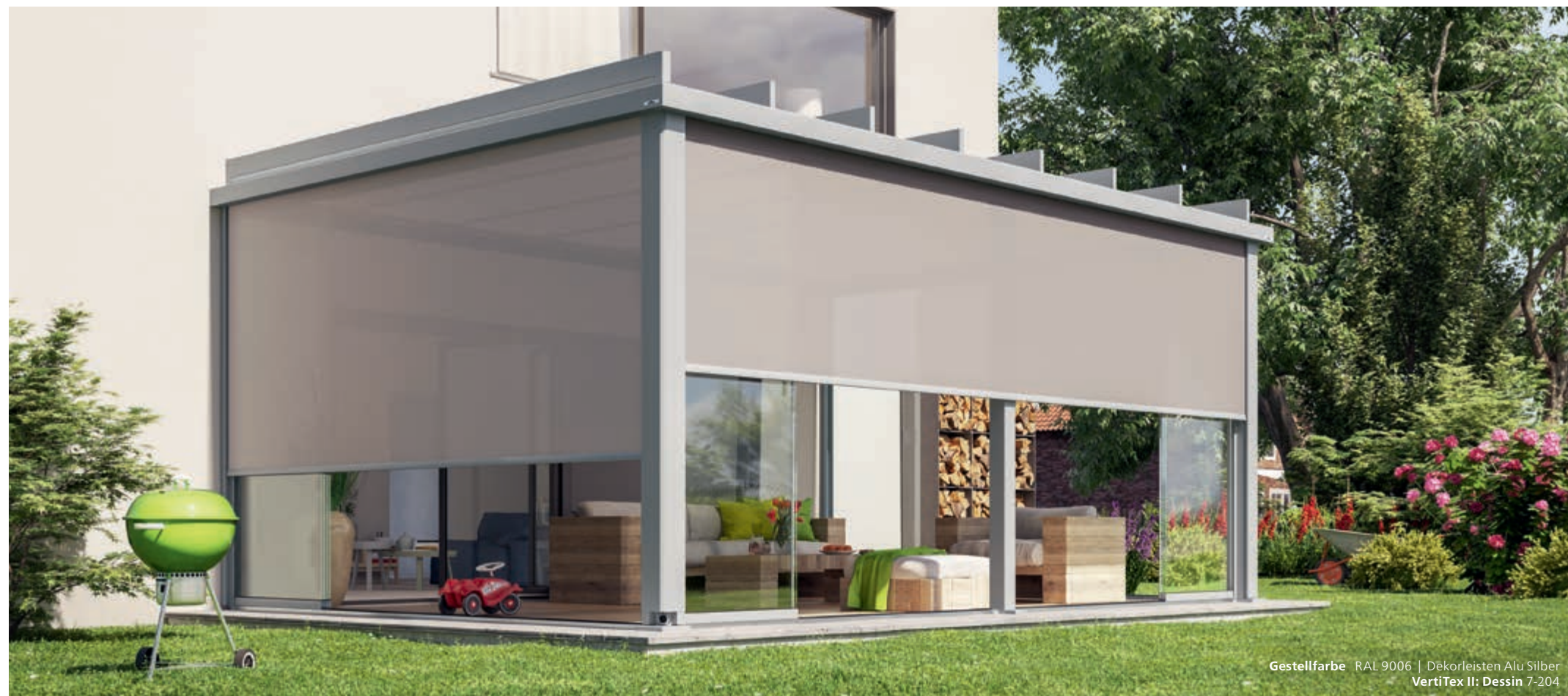
Gestellfarbe RAL 9006 | Dekorleisten Alu Silber VertiTex II: Dessin 7-204

Sie möchten von den Seiten und von vorne vor Blicken und blendendem Licht geschützt sein? Dann ist die Senkrecht-Markise VertiTex II von weinor die richtige Wahl. Die speziell für VertiTex II entwickelte Kollektion screens by weinor® umfasst eine große Auswahl an hochwertigen Tüchern. Und das patentierte weinor Opti-Flow-System® gewährleistet einen optimalen Tuchstand. VertiTex II für Terrazza Pure gibt es demnächst auch in der optisch attraktiven VertiPlus-Variante.